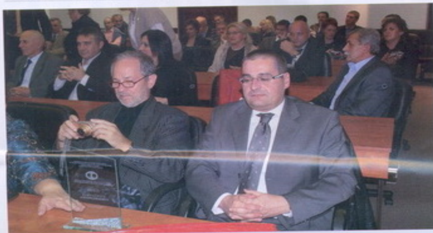
Са свечаности СФОС-а

Први трансни синдикат. Пуноправни члан УНИ финансије Европа. Захвалнице и планете заслужним организацијама и појединцима.