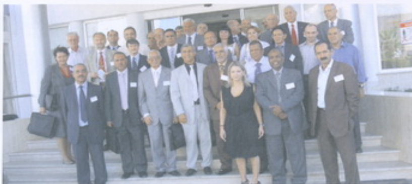
Председник СФОС-а на Конференцији синдиката банака Медитерана

Синдикат финансијских организација Србије има веома развијене односе са сродним синдикатима из иностранства. Још 1994. године потписан је протокол о сарадњи са грчким синдикатом банака ОТОЕ, а следеће, 1995. године и са кипарским синдикатом банака ЕТУК.